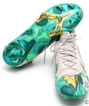
Chaussure signature de Kylian Mbappé, Nike, 2019. Inv.2020.1.1.1/2

-Découvrir comment le sport peut inspirer des créateurs.